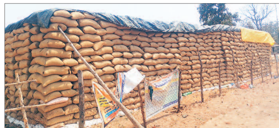
हरिभूमि न्यूज ►► सरोगा

कांकेर जिले के नरहरपुर विकासखंड अंतर्गत आदिम जाति सेवा सहकारी समिति बादल में धान उठाव नहीं होने से किसानों और समिति प्रबंधन को भारी परेशानी का सामना करना पड़ रहा है। मौसम की अनिश्चितता और प्रशासनिक सुस्ती के कारण खरीदा गया धान खुले आसमान के नीचे रखा हुआ है, जिससे खराब होने का खतरा लगातार बढ़ता जा रहा है। जानकारी के अनुसार समिति द्वारा अब तक लगभग 44,000 विंटल धान की खरीदी की जा चुकी है, लेकिन हेरानो की बात यह है कि अब तक मात्र 960 विंटल धान का ही उठाव हो पाया है। यानी खरीदी गई कुल उपज का बहुत ही छोटा हिस्सा ही परिवहन हो सका है। बाकी धान खुले में पड़ा हुआ है, जो बारिश, नमी और अन्य प्राकृतिक कारणों से नुकसान की आशंका में है। स्थानीय किसानों का कहना है कि उन्होंने