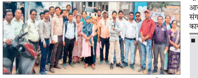
हरिभूमि न्यूज ►► चारामा