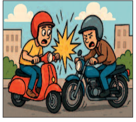
अज्ञात वाहन चालक की तलाश जारी